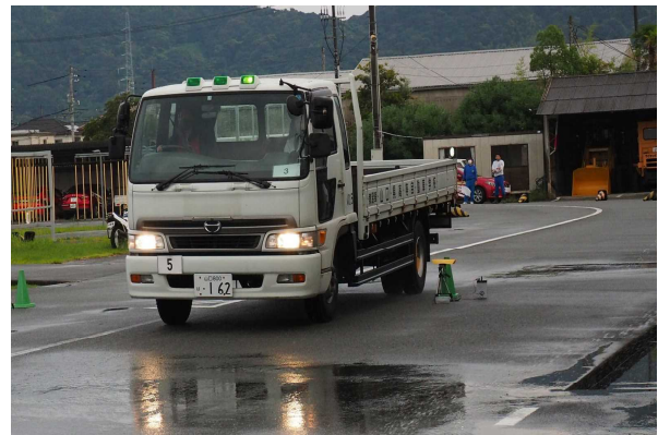
< 緊急回避体験 >