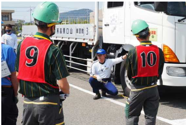
< 日常点検 >