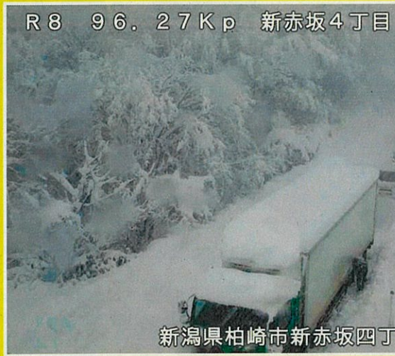
R8 96.27Kp 新赤坂4丁目