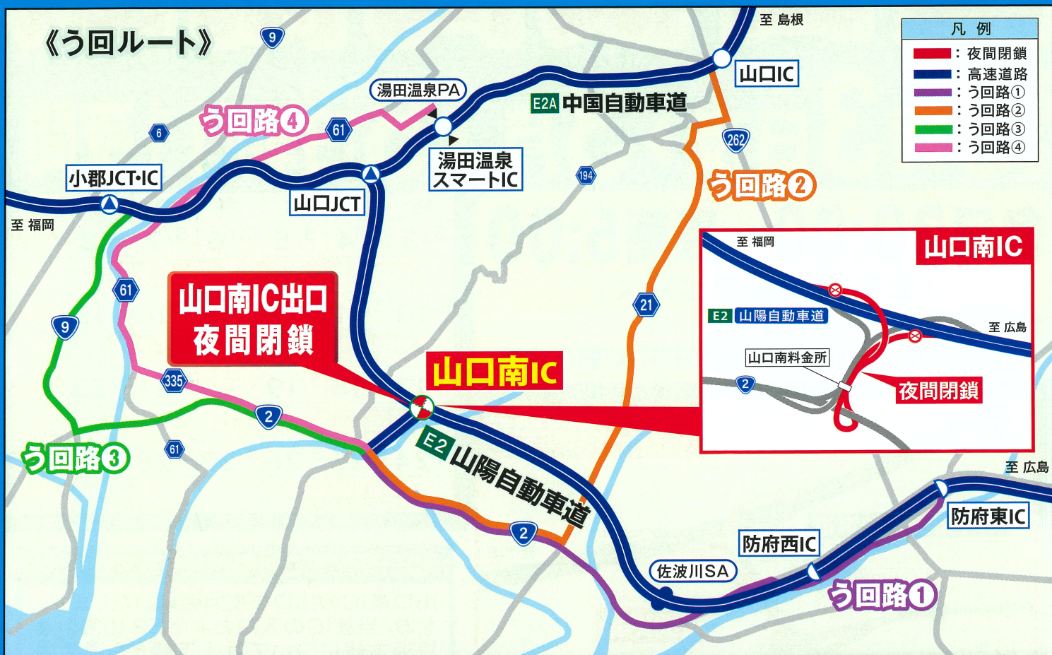
う回路① E2 山陽自動車道 防府東IC ⇒ 山口南IC

夜間閉鎖時に山口南IC出口のご利用を予定されているお客さまは、 下のう回路を参考に、一般道を利用したう回をお願いいたします。